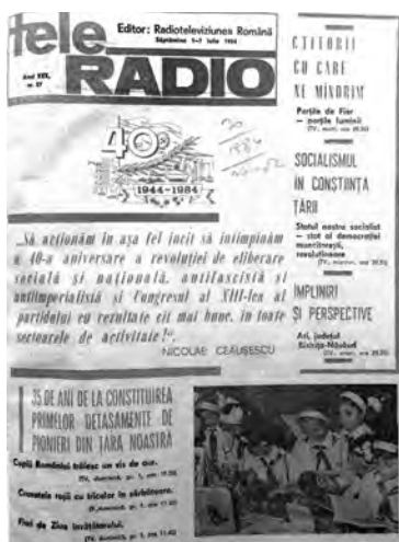
Programul săptămânal Tele Radio , editat de Radiodifuziunea Română (1984), stă mărturie, nu doar prin coperta sa, pentru cuprinsul predominant propagandistic al emisiunilor de radio și televiziune.

Televiziunea națională. Prima emisiune de televiziune din România a avut loc în noaptea de 31 decembrie 1956 – 1 ianuarie 1957, fiind transmisă din primul sediu al Televiziunii, aflat pe strada Molière din cartierul Floreasca, iar antena și emițătorul de 22 KW pe Casa Scînteii. Televiziunea a devenit un mediu preferat de propagandă