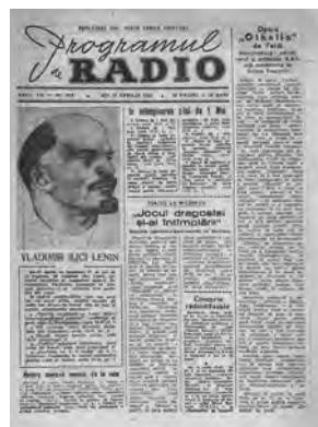
În 1957, de ziua de naștere a lui Lenin, 22 aprilie, Programul de Radio continua să publice pe prima pagină portretul fondatorului statului bolșevic.