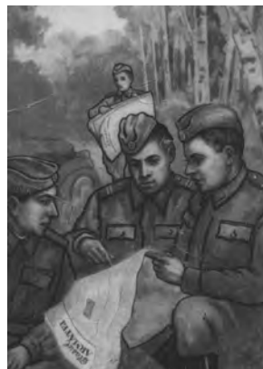
Carte poștală ilustrată din anii '50, editată de Direcția Politică Superioară a Armatei pentru a-i îndemna pe soldați să citească Glasul Armatei .

Radioul. Anii '70 pot fi considerați ca simptomatici din punctul de vedere al propagandei comuniste și al controlului ideologic exercitat asupra mass-mediei: deceniul a debutat prin acea aparentă relaxare produsă la sfârșitul anilor '60, a continuat cu ascensiunea spre puterea totală în stat a lui Nicolae Ceaușescu după lansarea „Tezelor din iulie 1971” și investirea sa ca președinte și s-a încheiat cu ascensiunea irepresibilă a cultului personalității dictatorului, asociată cu un naționalism-comunism din ce în ce mai intolerant. Simpla denumire a programelor de radio și a ciclurilor de emisiuni difuzate pe calea undelor cu acoperire pe toată suprafața României socialiste în anii '70 ilustrează această evoluție. Astfel, în noiembrie 1970, în cadrul emisiunilor „Memoria pământului românesc” se discutau doar teme