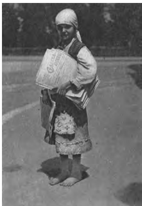
Carte poștală germană din timpul ocupației Capitalei (Primul Război Mondial – 1917-1918) înfățișând o tipică vânzătoare româncă de ziare, în cazul de față Gazeta Bucureștilor , editată în Sărindar.

și condiția, devenită legală, a jurnaliștilor de activiști/propagandiști ai partidului comunist.